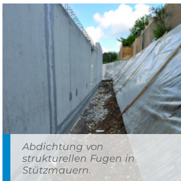
Abdichtung von strukturellen Fugen in Stützmauern.